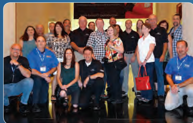
Conseil consultatif national 2012, Las Vegas, Nevada

Les conseils régionaux TECH-NET MD ont prouvé que la participation permet de profiter davantage du programme et ajoute au succès de la marque TECH-NET MD dans leur marché. Les membres partagent leurs pratiques d'excellence et discutent des facteurs des marchés de l'industrie, des façons de tirer profit des différents éléments du programme ainsi que des méthodes pour mettre leurs ressources en commun afin d'obtenir une meilleure présence pour leur investissement. Votre magasin CARQUEST MD peut vous aider à participer au conseil régional. Le conseil national TECH-NET MD est l'élément clé qui permet de renouveler le programme TECH-NET MD et d'être à l'écoute de vos besoins. Les membres de ce conseil se réunissent chaque année pour passer le programme en revue, pour évaluer les ajouts au nouveau programme et pour rehausser l'image générale du programme TECH-NET PROFESSIONNEL DE L'AUTO MD .